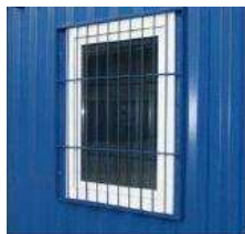
Fenster mit Gitter